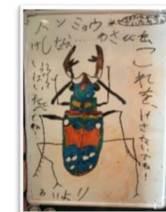
SCのお孫さんの作品第2弾!