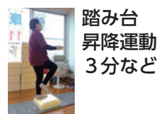
踏み台昇降運動 3分など